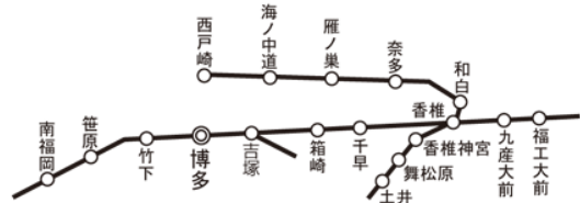
㊦ 福岡市内の駅 (姪浜駅、下山門駅、今宿駅、九大学研都市駅) 及び周船寺駅を除く