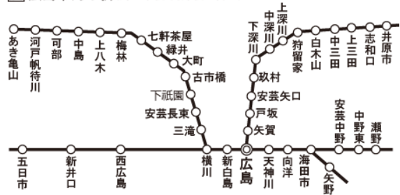
㊦ 広島市内の駅 (海田市駅・向洋駅を含む)