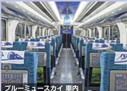
ブルーミュージスカイ 車内

※プレミアムプランにご参加の無料の未就学児童のお子様には上記の他、昼食、プランケットなどのプレゼントはございません。