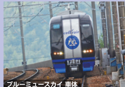
ブルーミュージスカイ 車体