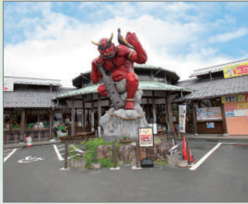
道の駅三角ほうし

宇和島駅⇄鬼北町内の宿泊施設とのシンプルな往復送迎セットプランです。往路:宇和島駅 → 各宿泊施設 および、復路:各宿泊施設 → 宇和島駅送迎のみの固定価格タクシープランです。