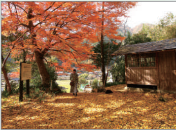
瑞林寺大いちょう

鬼北町内を発着起点として自由企画の3時間観光周遊のセットプランです。出発地や到着地が鬼北町内であれば周遊が自由な定額の固定価格タクシープランです。基本は3時間からですが、1時間単位で最大5時間まで可能です。