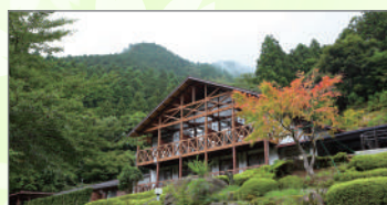
成川溪谷休養センター