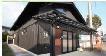
ゲストハウス西村サイクル