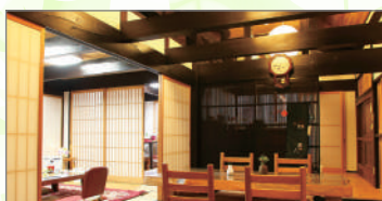
農家民宿山あじさい