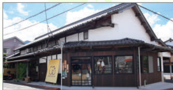
コワーキングスペースワームス

宇和島駅にお迎えの場合は特急宇和島の到着時間や高速バスの到着に合わせてお迎えにあがりますので、事前にお時間をお調べのうえ、申し込みください。