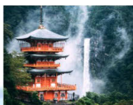
世界遺産・熊野那智大社