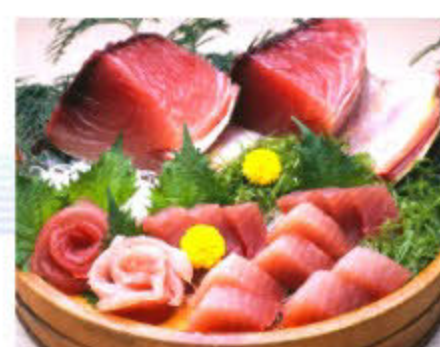
生マグロの水揚げ呈日本一