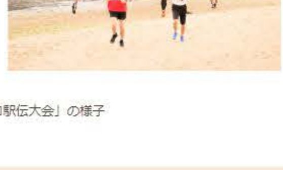
昨年度開催「西尾トンボロ駅伝大会」の様子