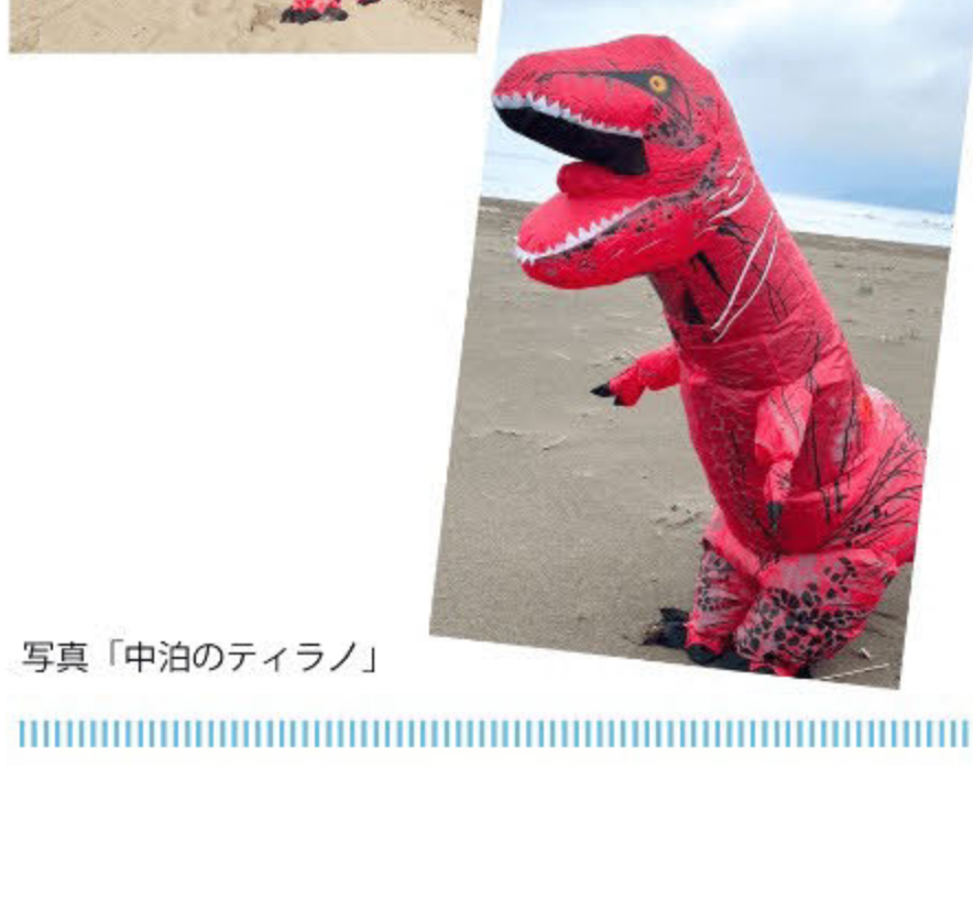
写真「中泊のティラノ」

ティラノサウルスレースとは・・・ ティラノサウルスの着ぐるみに身を包んでかけっこをする。大人も子供も楽しめる競技です！エキシビションとして会を盛り上げることも違いなし♪走行は50m程で、トンボロから海岸に向けてスタートします。定員は20名程度。早い者勝ちです！