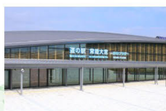
人気の道の駅で、ブランド牛「瑞穂牛」を堪能