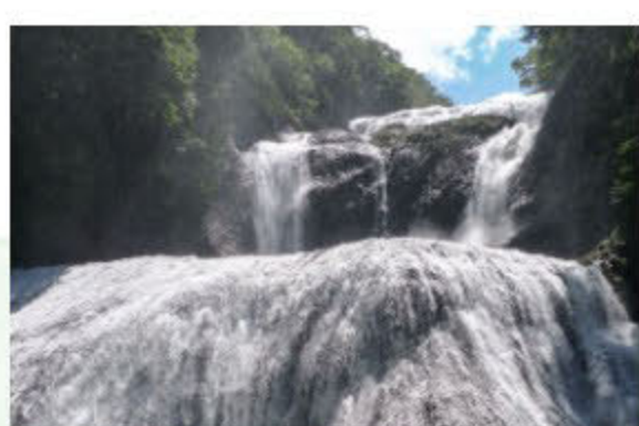
国名勝・袋田の滝

目を奪われる大自然、奥深い歴史と文化、美食家を隠らせる食があふれる茨城県最北西端に位置する大子町。そして那珂川と久慈川を抱く、風光明媚で人情豊かな「来たい」まち・常陸大宮市。日本の歴史・文化に触れたいあなたの心にきっと素晴らしい思い出として残る、魅力いっぱい茨城県北エリアへ、是非この機会にお越しください。