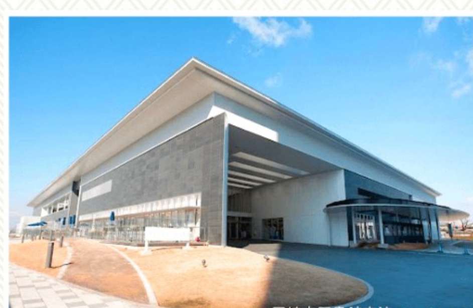
岡崎市図書館交流プラザ りぶら