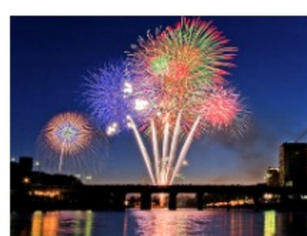
岡崎城下家康公夏まつり花火大会