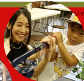
ワイナリー・ビン詰め体験（イメージ）