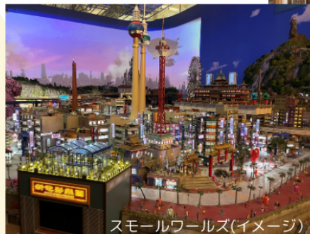
スモールワールズ(イメージ)