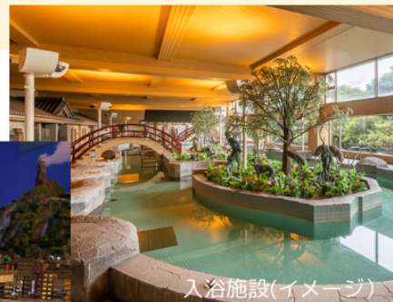
入浴施設(イメージ)