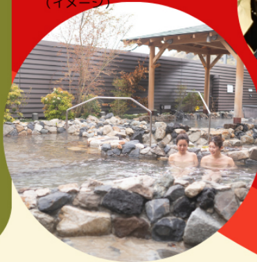
温泉：より道の湯（イメージ）