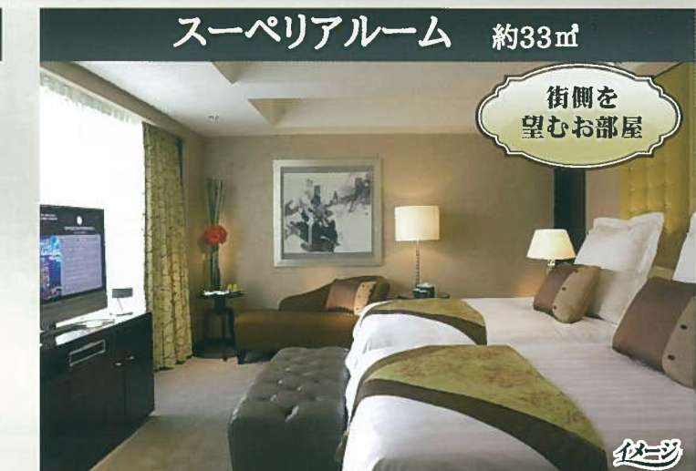
スーペリアルーム 約33㎡ 街側を望むお部屋