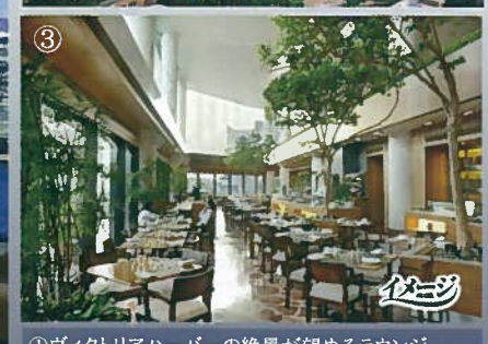
①ヴィクトリアハーバーの絶景が望めるラウンジ ②九龍半島チムサアチョイの中心で立地も抜群 ③カジュアルな雰囲気でもどんな時間帯にでも気軽に食事ができるダイニング。