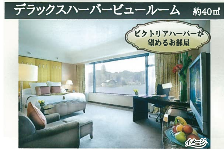
デラックスハーバービュールーム 約40㎡ ビクトリアハーバーが望めるお部屋