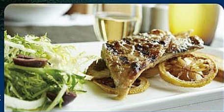
船内での洗練されたお食事の一例

＜客船スペック＞ 就航：2010年 総トン数：86,700t 全長：285m 最大幅：32m 巡航速度：21.9ノット