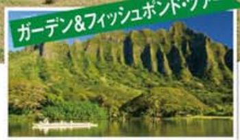
ガーデン&フィッシュボンドツアー 約800年前に造られたフィッシュボンド(養魚池)をカヌーでクルーズしながら、ハワイの緑豊かな自然と歴史に触れるアクティビティ。色鮮やかなトロピカル・ガーデンでは、ハワイ特有のさまざまな植物に出会うこともできます。