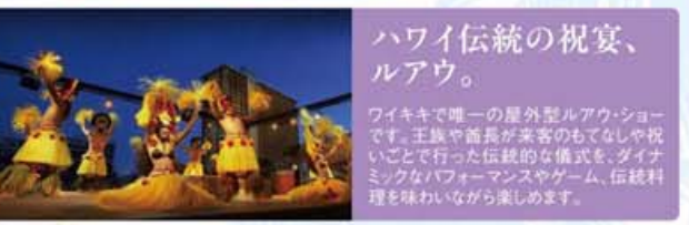
ハワイ伝統の祝宴、ルアウ。 ワイキキで唯一の屋外型ルアウ・ショーです。王族や酋長が賓客をもてなしや祝いごとで行った伝統的な儀式も、ダイナミックなパフォーマンスやゲーム、伝統料理を味わいながら楽しめます。