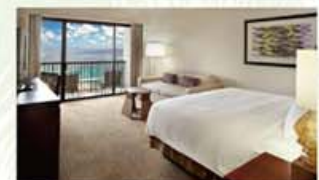
プライベートロビーに、専用フロントとコンシェルジュデスクを設けている「アライタワ」。アライとはハワイ語で王族という意味で、その言葉にふさわしいリゾートが過ごせます。

「2013年全米ベストビーチ」第2位に選ばれた、白砂のデューク・カハナモク・ビーチが目の前にある大型ホテル。敷地内には、青々と茂るトロピカルガーデンや滝などがあり、南国の楽園らしい空間が広がります。5つのタワーからなる館内には、18のレストラン、スパ、5つのプール、人気ブランドを集めたショップなども。また、毎週全曜日の花火、シュノーケリングや潜水艇ツアーなどのマリンスポーツ、ハワイの文化やアートに触れるアクティビティも豊富に揃います。 ◎2005 Kalia road., Honolulu.