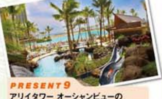
PRESENT 9 アライタワ オーシャンビューの宿券券(4泊)をペア1組に! ※ご利用可能期間は平成26年6月30日までの予約可能な日にも。詳しくはP20をご覧ください。