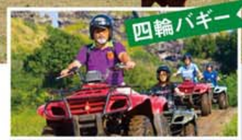
四輪バギー オフロード用の四輪バギーで広大な谷を駆けめぐる。迫力満点のアクティビティ。クアロア独特の地形を生かした、高低差約60mの緑豊かな山道コースでは、絶景パノラマが見渡せる高台の丘や草原、大自然の風を満喫できます。

オアフ島の北東部に位置する「クアロア牧場」。映画「ジュラシック・パーク」「ゴジラ」などのロケ地として知られ、切り立つ渓谷に囲まれた広大な自然は、スクリーンで見たそのままの景色。ロケ地をめぐる「映画村バスツアー」や乗馬、フラ・レッスン、アオウミガメが見られるクルーズなど、さまざまなアクティビティが充実。一日まるごと楽しめる秘境の大地です。 ◎49-560 Kamehameha Hwy., Kaneohe. 8:00~17:30 12/25、1/1休