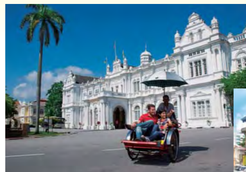
細部の装飾も見事なペナン市庁舎。

1786年、イギリス東インド会社のフランシス・ライトが寄港地を得るためにペナン島に上陸。それ以降、約170年に渡ったイギリス統治時代の面影が色濃く残る町並みは、2008年、世界遺産に登録されました。ジョージタウンの中心部はペナン島観光のハイライト。麗麗な白亜のコロニアル建築群、マレー、中国、インド式と多種多様な建物が相交り、文化の交流地として栄えた歴史を物語っています。名物トライショー(人力三輪車)に乗って、散策するのもおすすめ。